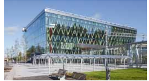
Resecentrum, Umeå.

Smidigare arbete över gränserna. En av fördelarna med införandet av Eurokod 5 är att vi får en gemensam beräkningsnorm i Europa och även i vissa andra länder. Det underlättar både utländska aktörers arbete och för svenskar som gör dimensioneringsberäkningar på utländska projekt. Dessutom kan det innebära vissa fördelar för svenska limträproducenter, eftersom även de kommer att jämföras utifrån samma förutsättningar som konkurrenterna i övriga Europa.