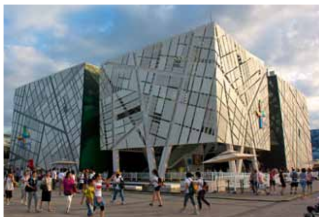
Svenska paviljongen, Shanghai.