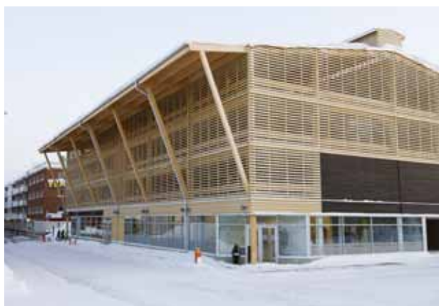
Parkeringshus, Skellefteå.

Professor i konstruktionsteknik vid Lunds Tekniska Högskola