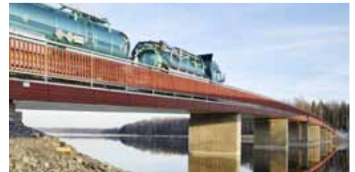
Plattbro, Iggesunds Bruk.

Säkerhet och kvalitet är redan på hög nivå i Sverige. Införandet av Eurokod 5 i Sverige väntas inte medföra några omedelbara förbättringar av säkerheten hos limträstommar. Framför allt beror det på att svensk limträindustri sedan tidigare redan ligger långt fram vad gäller säkerhetsfrågor och kvalitet. En av förändringarna jämfört med gamla BKR är att det i vissa fall kommer att krävas lite större dimensioner än tidigare, för att leva upp till normerna i Eurokod 5.